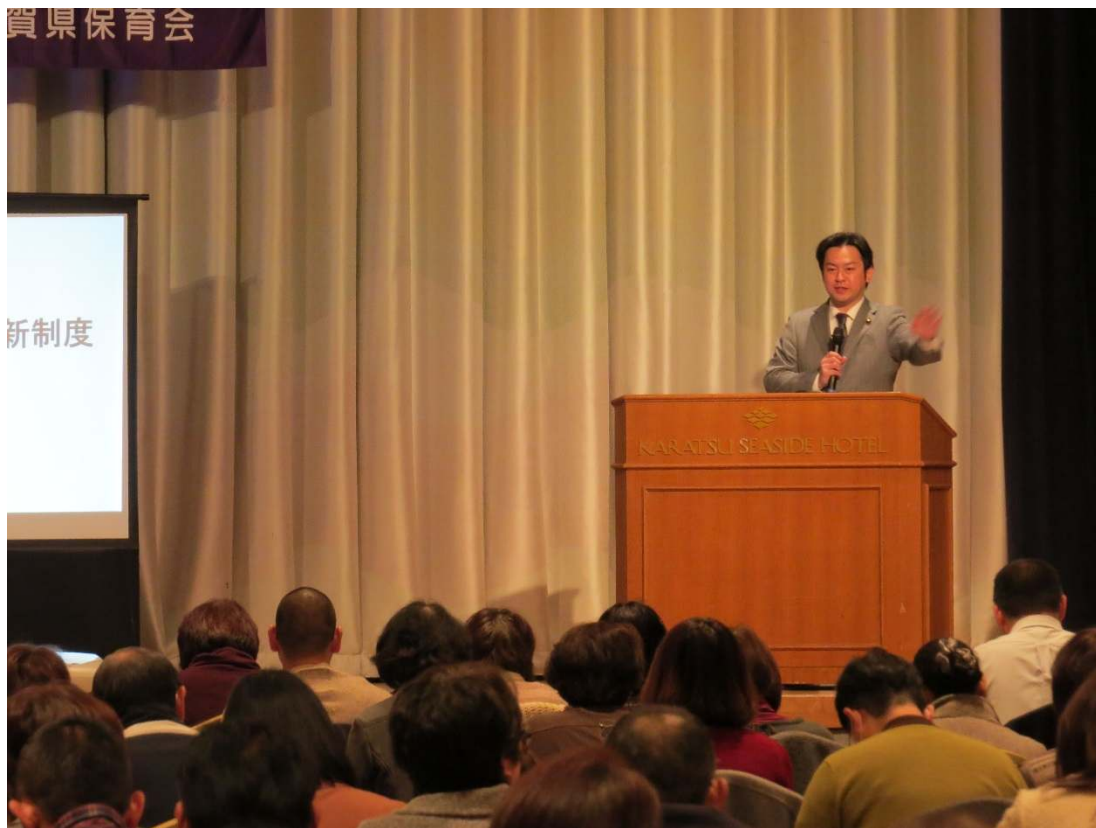
10 : 20～11 : 00 ④『子ども・子育て支援新制度について』 講師：参議院議員 福岡 資麿 氏